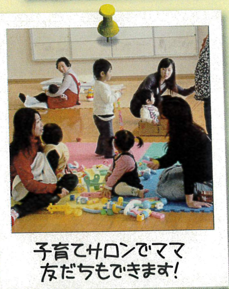
子育てサロンでママ友たちもできます！