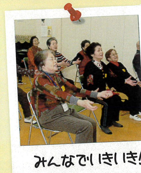
みんなでいきいき！