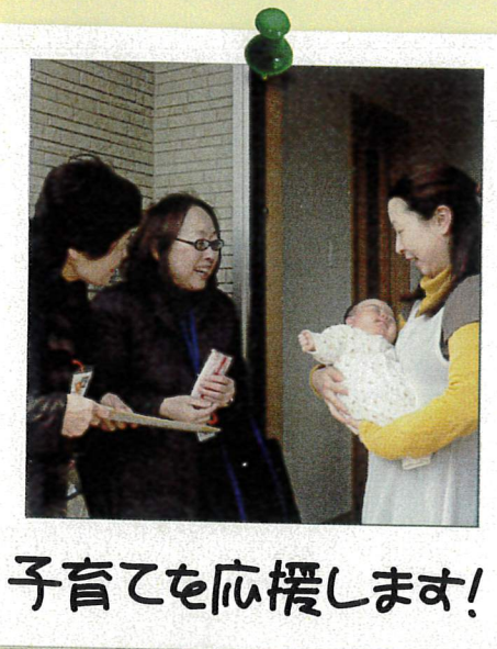
子育てを応援します！