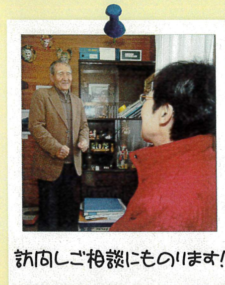
訪問しご相談にものります！