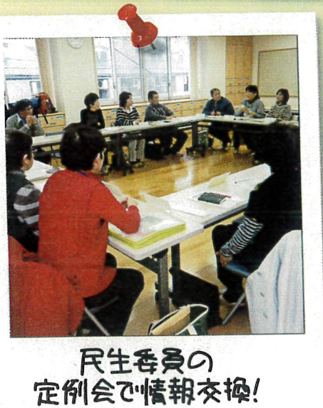
民生委員の定例会で情報交換！