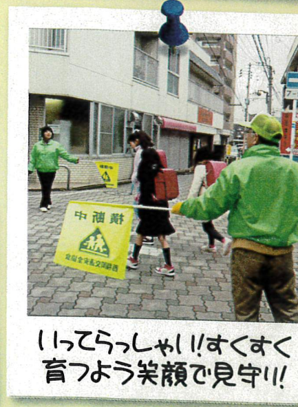
いってらっしゃい！すくすく育つよう笑顔で見守り！